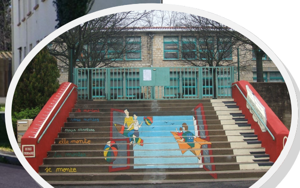
Rénovation du groupe scolaire (électricité, menuiserie, isolation.....)