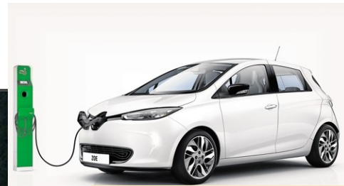
Voiture électrique Zoé