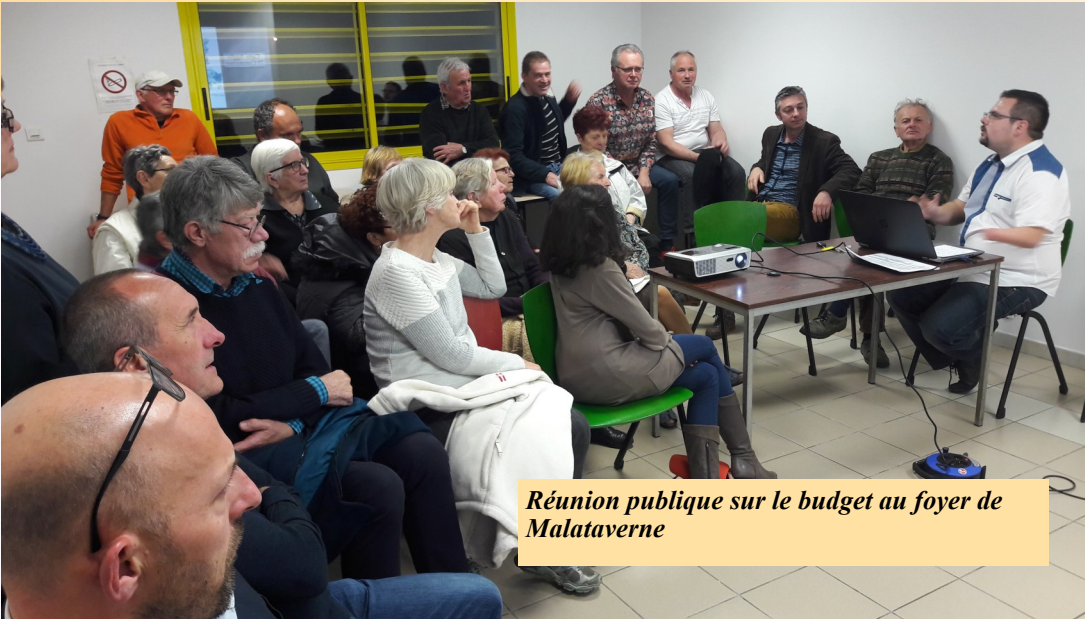
Réunion publique sur le budget au foyer de Malataverne