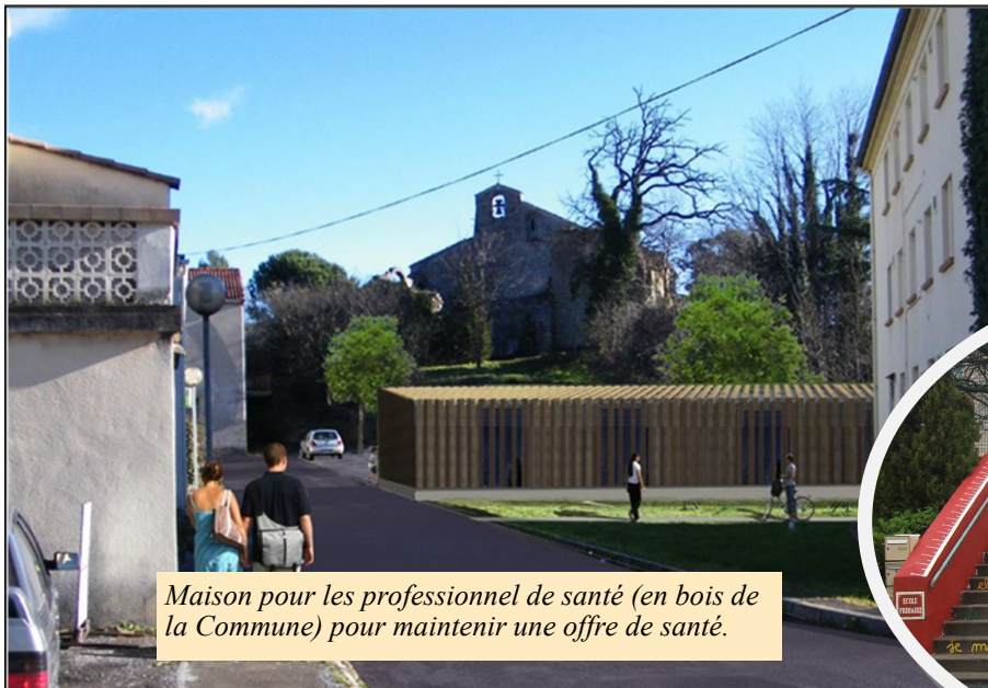
Maison pour les professionnels de santé (en bois de la Commune) pour maintenir une offre de santé.